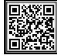
Institution Location QR