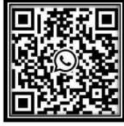
Whatsapp Group QR